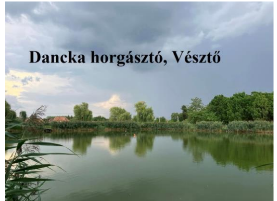
Dancka horgászto, Vesztő